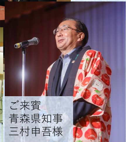
ご来賓 青森県知事 三村申吾様